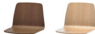
— Walnut shell Carcasa de nogal