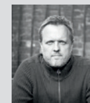
VARYA WOOD Designed in London by Simon Pengelly www.simonpengelly.com