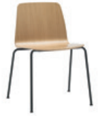
4 leg Silla 4 patas