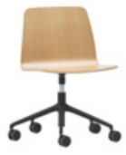
Aluminum swivel base Base giratoria de aluminio + casters / ruedas + gas lift / elevación gas