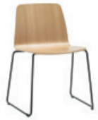
Sled base Pie de varilla