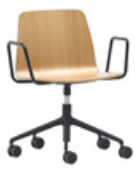
Aluminum swivel base Base giratoria de aluminio + arms / brazos + casters / ruedas + gas lift / elevación gas