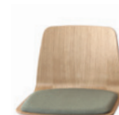
— Upholstered seat pad Asiento tapizado