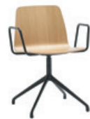
Aluminum swivel base Base giratoria de aluminio + arms / brazos