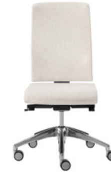
Chair synchro upholstered high backrest Silla sincro con respaldo alto tapizado