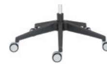
5 star Polyamide 5 radios poliamida + casters / ruedas