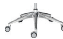
5 star polished aluminium 5 radios aluminio pulido + casters / ruedas