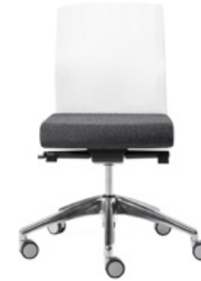
Chair synchro w/mesh medium backrest Silla sincro con respaldo medio de malla