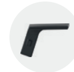
Standard adjustable arm Brazo regulable estándar