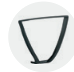
Fix arm Brazo fijo