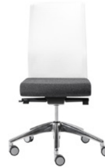
Chair synchro w/mesh high backrest Silla sincro con respaldo alto de malla