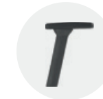
4D adjustable arm in polyamide Brazo regulable 4D de poliamida