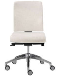
Chair synchro upholstered medium backrest Silla sincro con respaldo medio tapizado