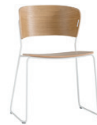
— Sled base Pie de varilla