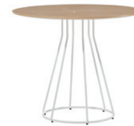
— Table Mesa