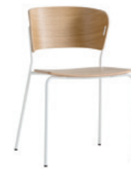
— 4 leg 4 patas