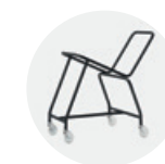
— Trolley Carro