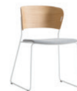
— Upholstered seat Asiento tapizado