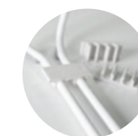
— Linking clips Clips de unión